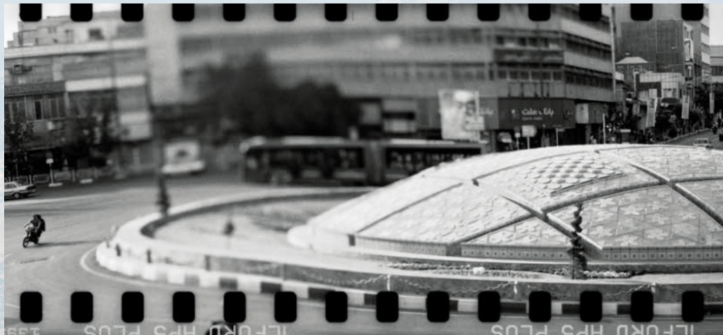
Links: Fotokomposition der mit Hasti Molavian befreundeten iranischen Fotografin Tahmineh Monzavi. Wir bedanken uns für die Erlaubnis zum Abdruck