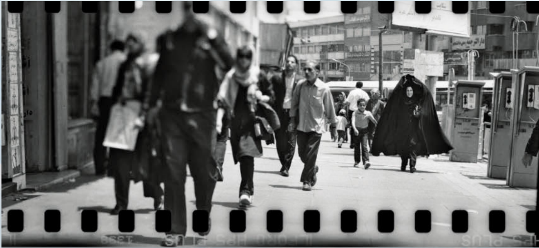
Eine weitere Fotokomposition von Tahmineh Monzavi

ICH SCHAUE TRAURIG, STAUNEND AUF DEIN ANGESICHT DIE HINTER KALTEN GITTERSTÄBEN ICH GEFANGEN BIN ICH TRÄUME, EINMAL KÄME EINE GROSSE HAND UND ICH WÄR PLÖTZLICH FREI UND FLÖGE ZU DIR HIN