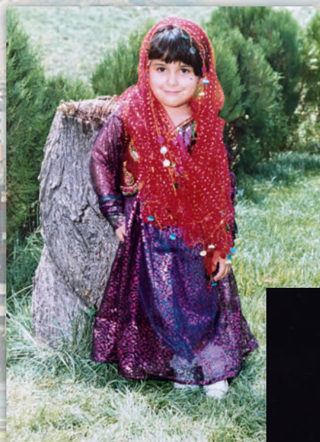
Links: Hasti Molavian, Autorin dieses Artikels. Die übrigen Fotos stammen aus Hasti Molavians Kindheit im Iran, das Hintergrundfoto zeigt die Stadt Teheran